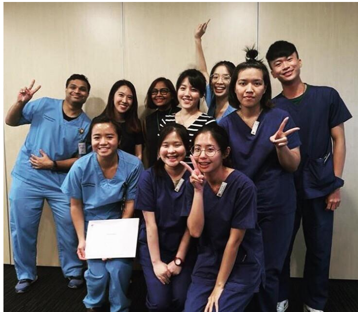
歡送會上和學長姐合影

語，但他們還是習慣用口音非常重的英文對話，加上醫院內也有很多菲律賓或是馬來西亞的呼吸治療師，我們花了好一陣子才習慣他們的口音。實習期間我們也會發現他們很多器材和疾病的名字和我們學到的有些差異，許多縮寫也是他們醫院自己獨有的，所以在查閱病例方面我們也遇到很大的困難。新加坡和台灣的呼吸治療師在工作內容方面有很多不同，像在台灣我們可以給予病人吸入型藥物，但在新加坡這卻是醫師的職責範圍；但新加坡的呼吸治療師是可以自己抽動脈血送驗的，台灣則不行。在任何國家的任何一間醫院，呼吸治療師的工作定位和職務內容都有所不同，我們應該學習在各種環境下都能靈活運用我們吸收的學理知識而不受外在因素影響。