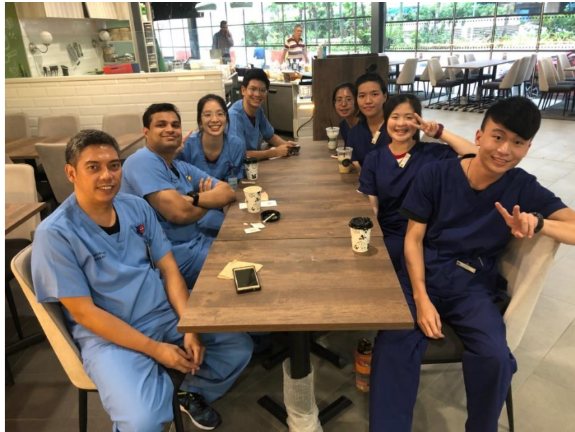
與 TTSH 的 RT 合影

這次我們前往見習的醫院是位於整個新加坡正中央的陳篤生醫院，因為地理位置，來自國內四處甚至其他國家的病人都會來到這裡就醫，可以想見它的規模之大。因為我們是高醫呼治系第一屆學生到那邊實習，對於醫院是完全的陌生並充滿未知，我們懷著既緊張又興奮的心情開始了為期兩個禮拜的醫院實習。兩個禮拜的平日一到五，我們總共到五個不同的單位去實習，包括四個 ICU 和一個普通病房。