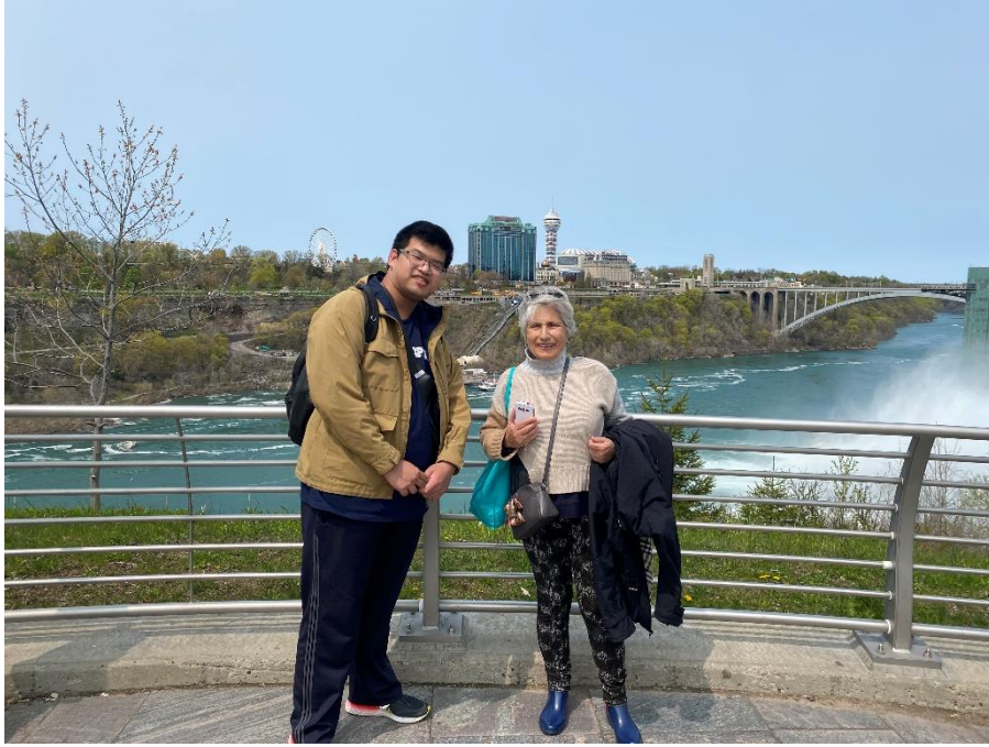
▲旅行途中認識的朋友們