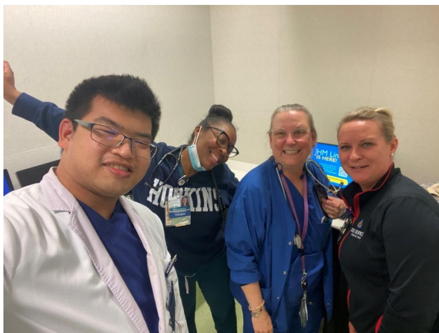
▲在 CVSICU 與學姊們的合照

相對於台灣，JHH的呼吸治療師需要負擔的病患數較少，且有十分特殊的home unit的制度，能夠依照自己的專長選擇自己的單位，如此對於臨床技術的熟悉度能夠更高，也能花更多時間去評估每個病人，達成更好的醫療品質。對於實習生，臨床老師都很願意放手讓我操作，即使是比較生疏的技術也會盡量先用口述給我一些提示再出手給予些許輔助。而在做支氣管鏡時，醫師也會很熱情的讓出視角最清晰的位置給學生甚至還讓我協助放置導線，在短短一個月得到了相當豐富的經驗，更懂得如何跟病人互動，遇到了許多值得學習的臨床老師們，也期望自己能累積經驗成為心目中理想的呼吸治療師。