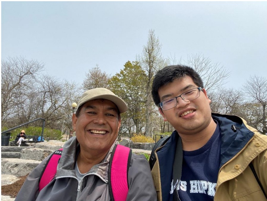
▲旅行途中認識的朋友們