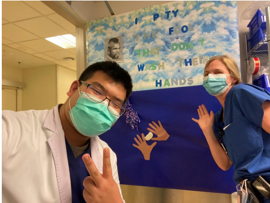
▲在 SICU 時協助製作洗手宣導海報