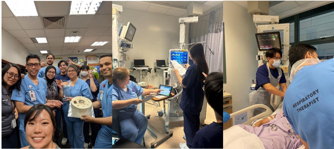
(圖中依序為在陳篤生醫院與師長之合照、臨床模擬測驗、實際操作肺部超音波)

已在體驗了那麼多、提升了自己語言能力並拓展視野後，可以好好地帶著這些收穫應用在未來的臨床實習和工作上，持續努力精進自己。