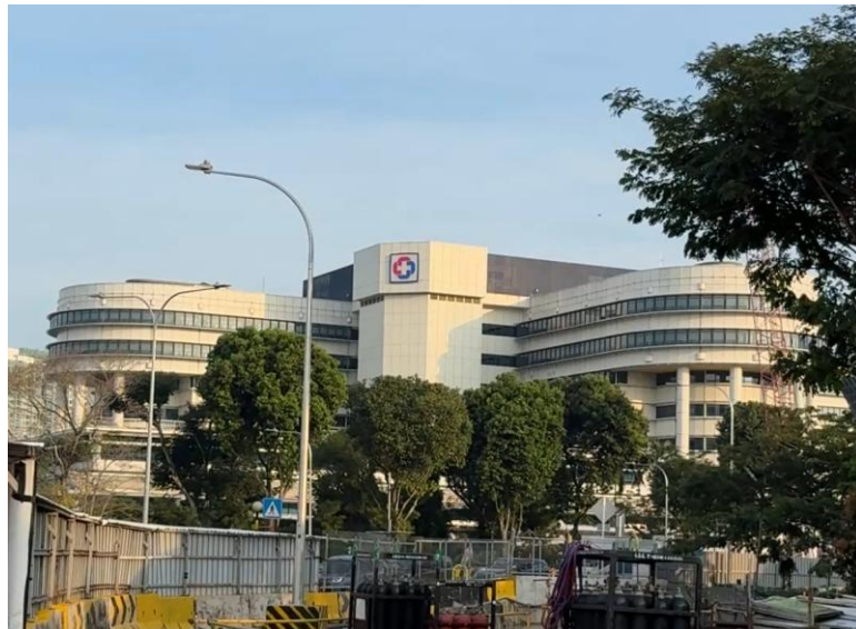
(圖一) 上班路的醫院

竹腳婦幼醫院 (KK Women' s and Children' s Hospital, KKH) 是新加坡規模最大的公立婦女與兒科專科醫院。創立於 1858 年，最初為一所小型綜合醫院，經過多年發展，如今已擴展為擁有 830 張病床的專科醫療中心，提供包含婦科、產科、新生兒科及小兒科在內的全面醫療服務。